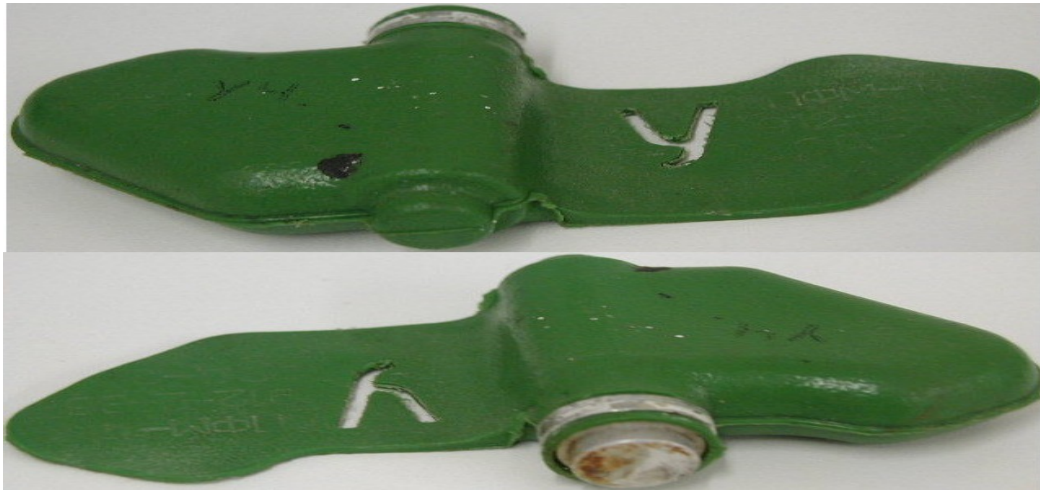
Размеры «Ми́ны – ЛЕПЕСТКА»: