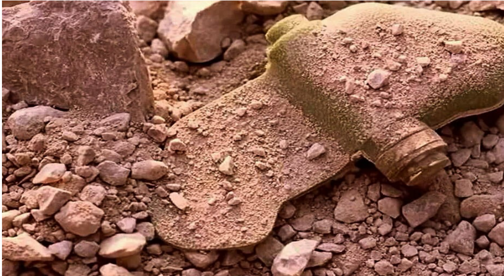
«Мина – ЛЕПЕСТОК» в боевом положении на тропе: