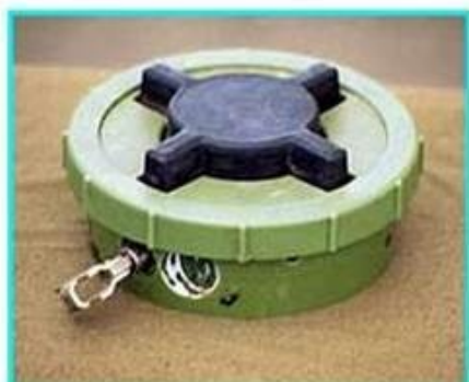
Рис.1 Общий вид мины ПМН-2