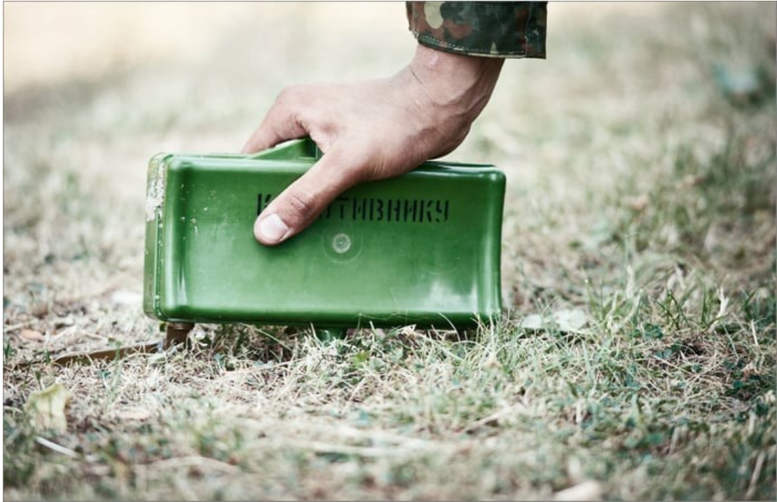
Мина в боевом положении