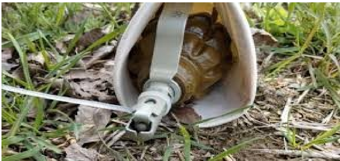
120 мм минометная мина